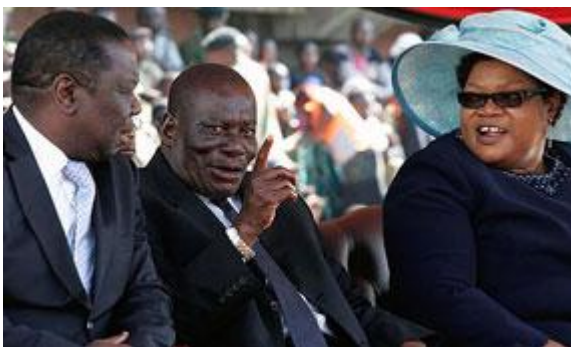
De Mujuru's en Tsvangirai (links)

Begin dit jaar begon de tijd te dringen. Mugabe bleek ernstig ziek te zijn en mogelijk 2012 niet te halen. Ineens werd voorgesteld om al in 2011 verkiezingen te houden, zelfs zonder grondwetswijziging. Zo zou Zanu-pf de verkiezingen in kunnen gaan met Mugabe als presidentskandidaat en meer tijd creëren voor de opvolging van Mugabe. Kan de Zanu-pf namelijk een regering vormen zonder de MDC, dan kan de opvolging van Mugabe binnen de partij worden geregeld.