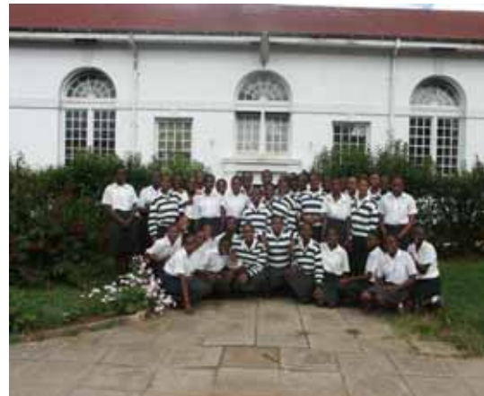
De deelnemers aan Zimquest op Mutare Girls High-school