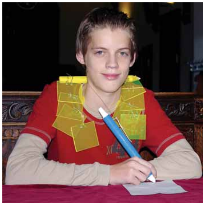
Een leerling met een van de ontwerpen van de ketting.

Als u onderstaande bon invult en opstuurt naar: