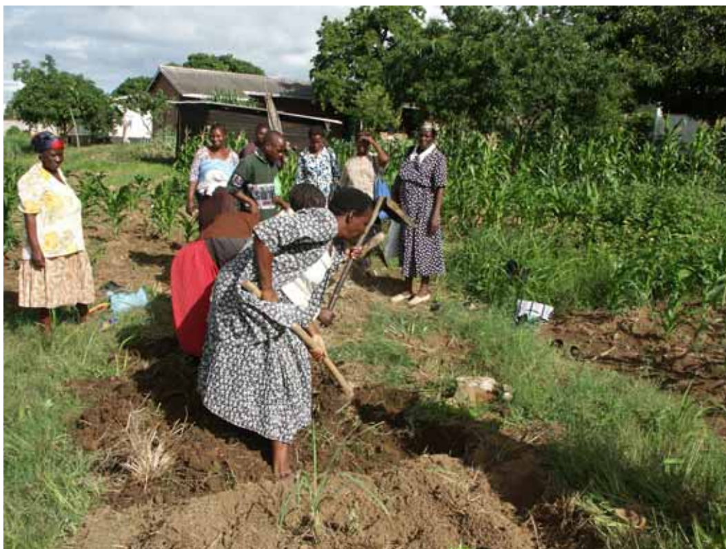
Urban agriculture op het terrein van Zororai