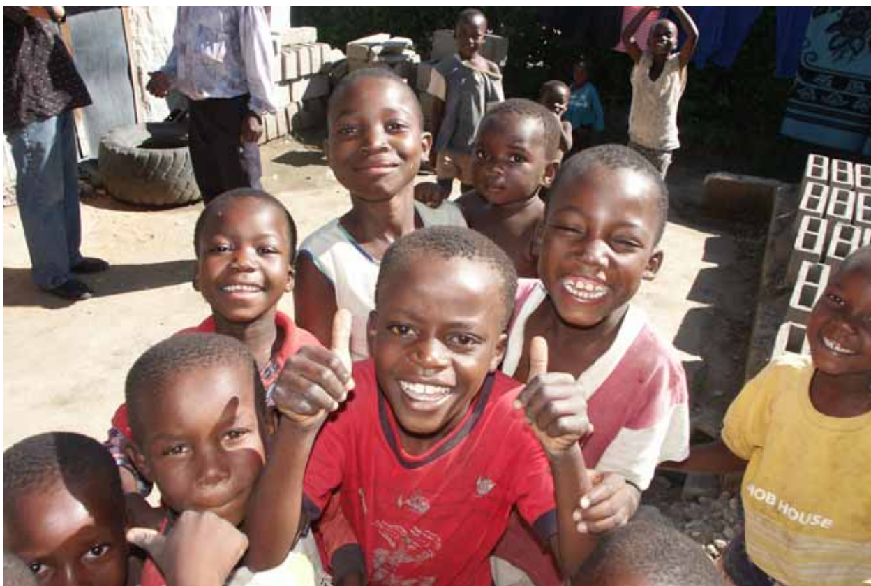
Op bezoek in Hobhouse voor het huisvestingsproject, januari 2007

No. 60, april 2007 — Verschijnt 4 x per jaar