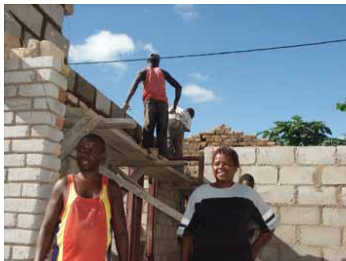
Bouw van woningen in Hobhouse vordert goed

Zo op het eerste gezicht was er in Mutare niet zoveel veranderd. Akkoord, het wegennet was verslechterd, maar dat is bij ons ook niet geweldig. Ook hier minder verkeer op straat en bijna nergens meer taxi's te zien. Keek je beter rond dan zag niet alleen ook minder mensen op straat, maar vooral minder vrolijke mensen. De blikken waren overwegend dof en somber. Niet zo vreemd als je de berichten van de laatste jaren