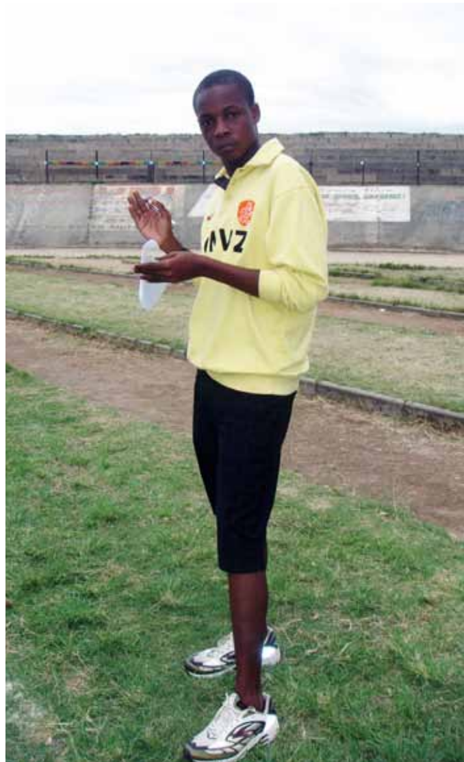
Obay in Sakubva Stadium, tijdens de stage van de CIOssers werd een sportfestival georganiseerd waar ook gehandicapte jongeren aan deelnamen.

Tegenover deze negatieve constatering stonden de vriendelijke bejegening van de Mutaresen, de leergierigheid en het hoge sportniveau van de kinderen en het lekkere eten, dat de jonge Haarlemmers positief raakten. Het is geestig dat ze zich vaak stoorden aan hoe de Mutaresen met hun mobieltjes omgingen. Kennelijk is het in Mutare