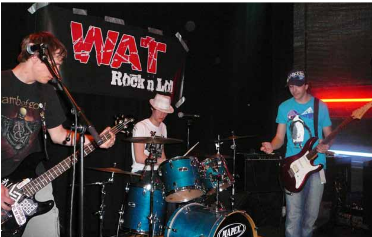
Optreden van WAT tijdens het benefietconcert op 30 april in het Patronaat

In de campagne 'Zimbabwaanse Jongeren Helpen Elkaar' vraagt de Stedenband aandacht en steun voor het peer education programma. Deze campagne werd mede mogelijk gemaakt door een subsidie van de NCDO en de gemeente Haarlem.