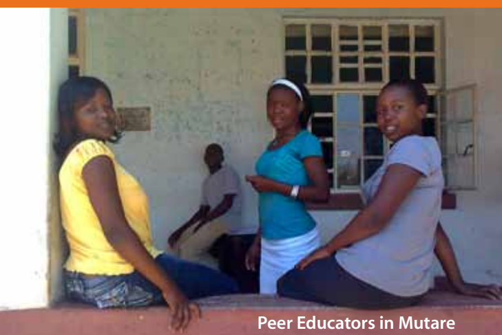
Peer Educators in Mutare