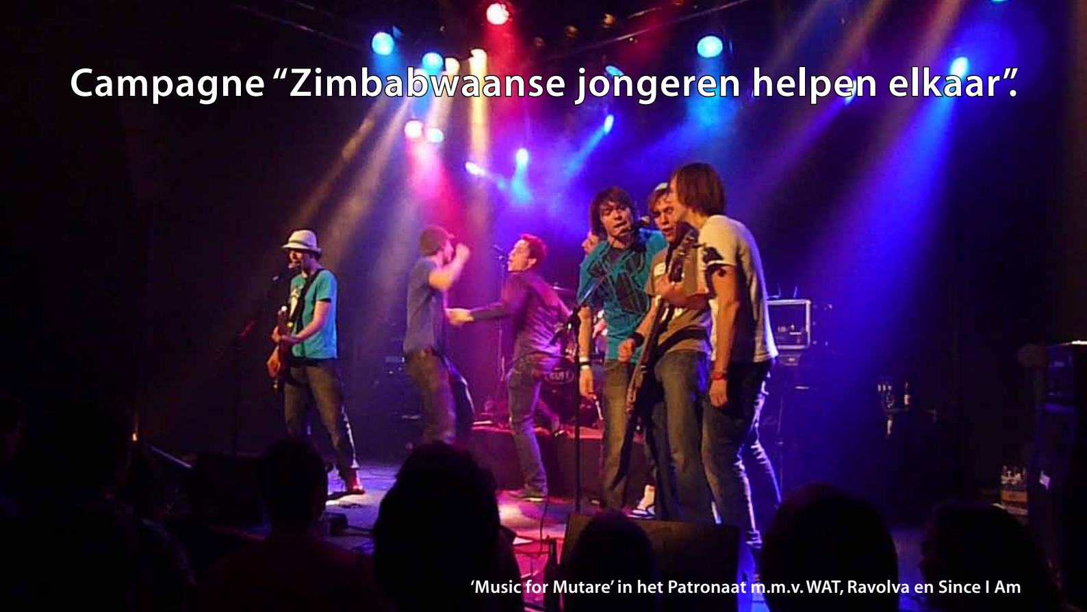
'Music for Mutare' in het Patronaat m.m.v. WAT, Ravolva en Since I Am