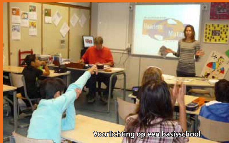
Voorlichting op een basisschool