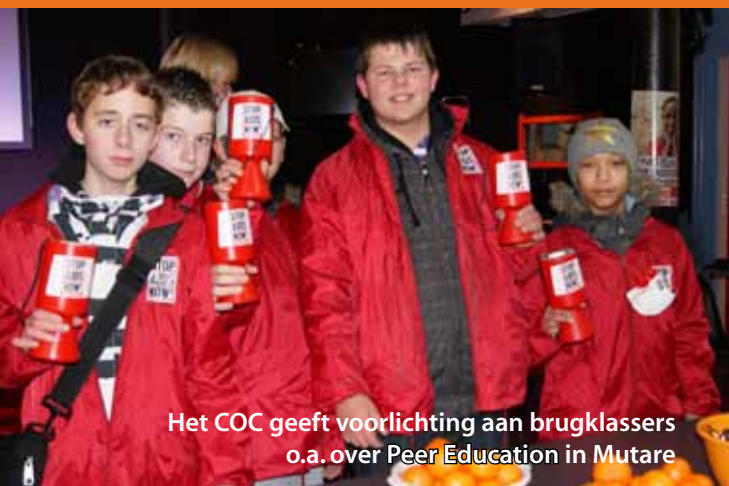
Het COC geeft voorlichting aan brugklassers o.a. over Peer Education in Mutare